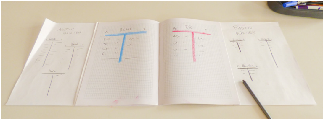
Schülerheft: Zum Ausklappen die laufend nachgeführten Konten, innen Bilanz- und Erfolgsrechnung

Einmal pro Woche wurden die Verkaufszahlen und andere Buchungen gemeinsam eingetragen, was jeweils wenige Minuten in Anspruch nahm. Zum Ende des Kalenderjahres (Dezember) erstellten wir eine erste Zwischenbilanz , deren Aussagen mit Spannung erwartet wurden.