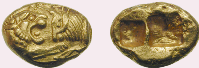
Königreich Lydien, Krösus, leichter Stater

Etwa 700 Jahre vor Christi Geburt setzt eine neue Entwicklung ein. Es bildeten sich damals in der Region des heutigen Griechenlands erstmals staatliche Strukturen mit formalisierter Gesetzgebung heraus. Gleichzeitig entstand dort auch das Münzwesen. Während im alten Mesopotamien (und auch Ägypten) die Tempelangeestellten und Arbeiter mit Zuteilung von Rationen entlohnt wurden, tritt nun die Bezahlung mit Münzen auf, die jeweils das Zeichen des Stadtstaates tragen, in welchem sie geprägt wurden. Die allerersten Münzprägungen wurden von den Tempeln aus impulsiert. Die Bezahlung der Staatsangestellten war jedoch der hauptsächliche Faktor, der zur Ausbreitung der Münzen beitrug, wobei das Militär die wichtigste Rolle spielte. Mit den Heereszügen von Alexander dem Großen gelangte das Münzwesen in den Osten, wo es den Untergang der alten Tempelbuchhaltungssysteme besiegelte. Mit den Römern gelang das Münzwesen in den nordeuropäischen Raum bis nach England, von wo aus es sich beinahe über die ganze Welt verbreitete.