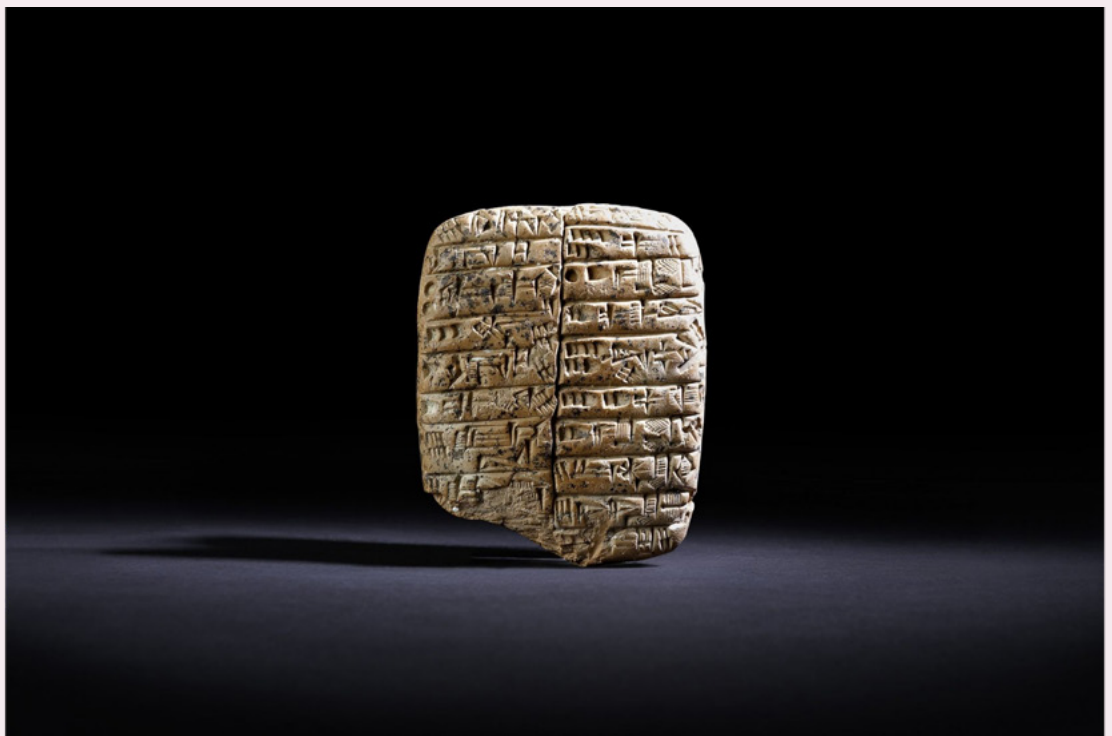
Mesopotamische Tontafel mit Keilschrift

Eine komplexe Tempeladministration verwaltete die Produktionsmittel, die wirtschaftliche Produktion und die Verteilung der Güter. Münzen und Noten wurden nicht verwendet. Um die wirtschaftliche Verwaltung zu bewerkstelligen, wurde über alle wirtschaftlichen Prozesse Buch geführt. Dazu wurde ein Zeichensystem entwickelt, woraus später die mesopotamische Schrift entstand. Diese auf Tontafeln aufgedruckten Zeichen ermöglichten das genaue Festhalten von Arbeitszeiten, Produktionsmengen und Verteilung von Gütern.